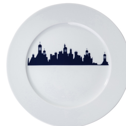
Plate 280 Chambord linear skyline Ø 280 mm 215328BL1-C00881