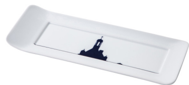
Plateau Chambord skyline linéaire Rectangular tray Chambord linear skyline 221 x 86 mm 223322BL1-C00881