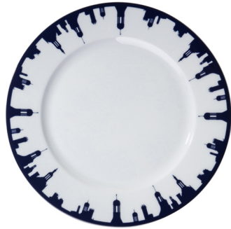
Assiette 220 Chambord skyline circulaire Plate 220 Chambord circular skyline Ø 220 mm 215322BL1-C00881C