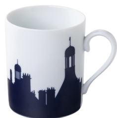
Mug Chambord skyline linéaire Mug Chambord linear skyline 30 cl 510324BL1-C00881