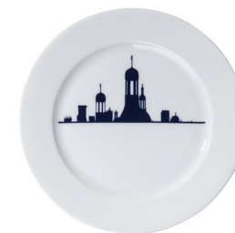
Plate 170 Chambord linear skyline Ø 170 mm 215317BL1-C00881