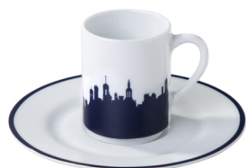
Paire tasse café Chambord skyline linéaire Coffee cup & saucer Chambord linear skyline 8 cl / H63 mm 995309BX1-C00881