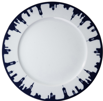
Assiette 280 Chambord skyline circulaire Plate 280 Chambord circular skyline Ø 280 mm 215328BL1-C00881C