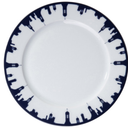
Assiette 170 Chambord skyline circulaire Plate 170 Chambord circular skyline Ø 170 mm 215317BL1-C00881C