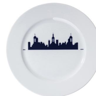
Plate 220 Chambord linear skyline Ø 220 mm 215322BL1-C00881