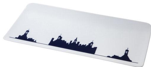
Assiette rectangulaire 340 Chambord skyline linéaire Rectangular plate 340 Chambord linear skyline 340 x 160 mm 223334BL1-C00881