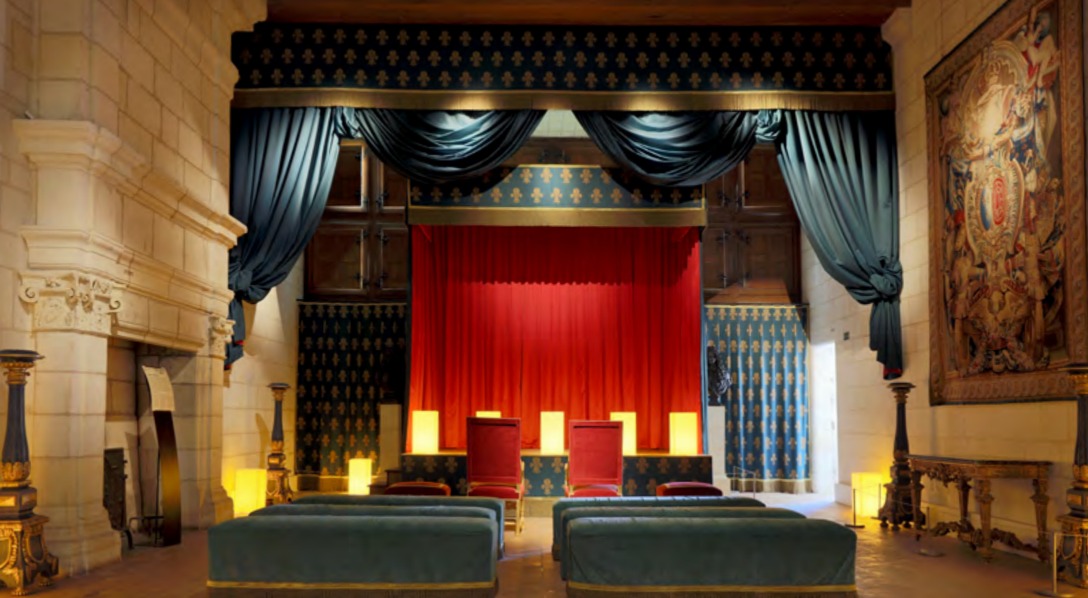
Les travaux du théâtre de Molière achevés