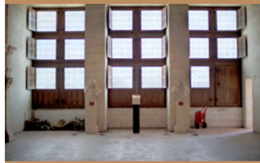
Le bras de croix sud au premier étage avant l'installation du théâtre

Le Roi-Soleil réside à plusieurs reprises dans le monument en compagnie de sa cour. Ces séjours sont l'occasion de grandes parties de chasse et de divertissements. Ainsi, Molière présente-t-il pour la première fois à Chambord deux de ses célèbres comédies-ballets, mises en musique par Jean-Baptiste Lully : Le Bourgeois gentilhomme , le 14 octobre 1670 et l'année précédente, Monsieur de Pourceaugnac .