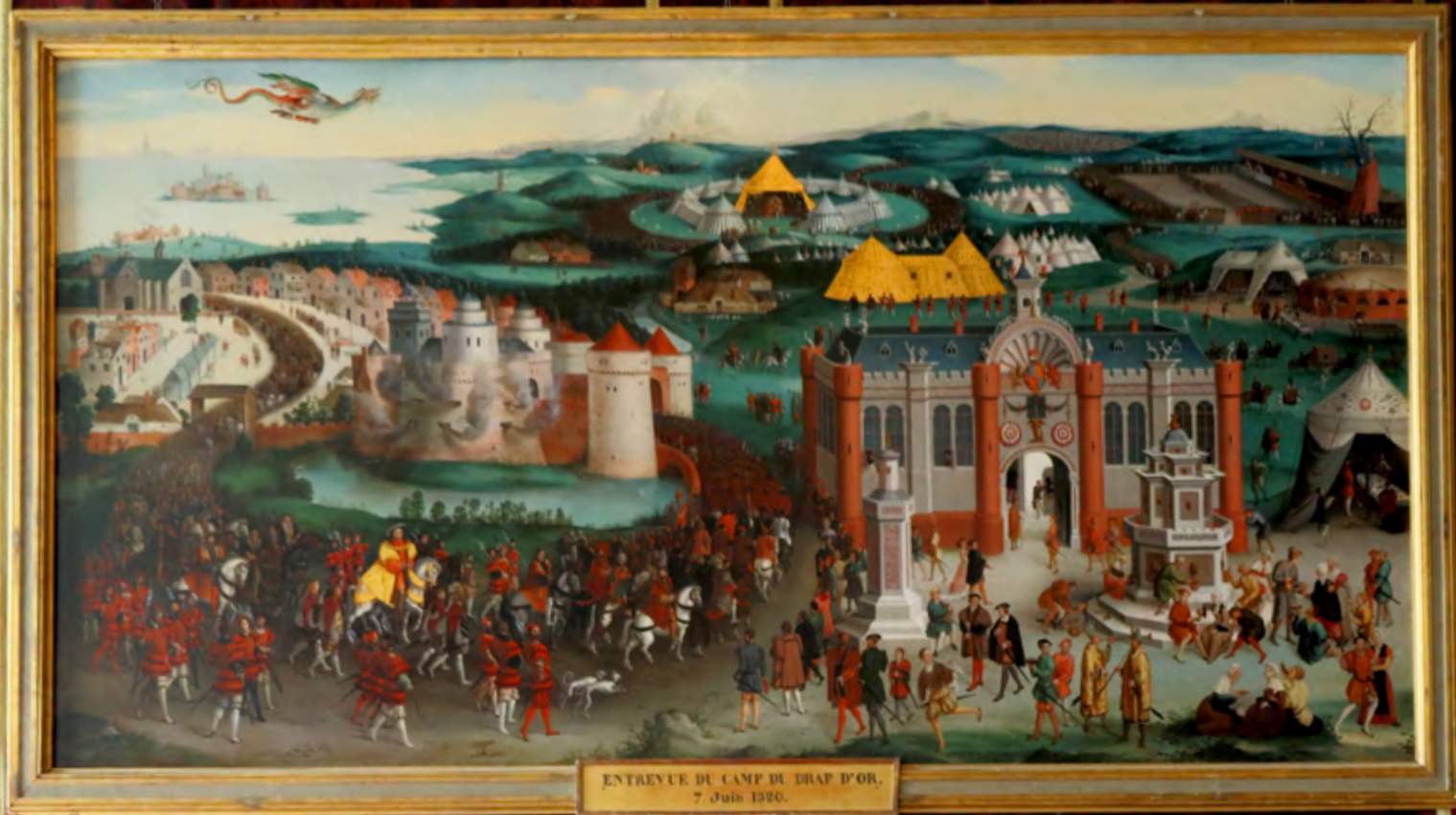
ENTREVUE DU CAMP DU DRAP D'OR, 7 Juin 1320.