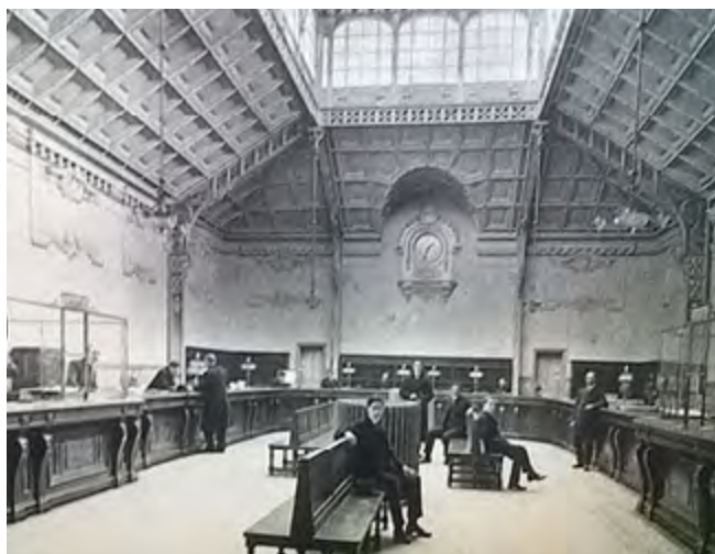
L'agence d'Orléans-Escures en 1880

Banque coopérative avec 260 000 sociétaires, la Caisse d'Épargne Loire-Centre regroupe 195 agences, 6 centres d'affaires et compte 1700 collaborateurs au service des projets de ses clients. Soit 956 000 clients auxquels elle apporte des réponses sur mesure dans la banque et l'assurance, dynamisées par la transformation digitale.