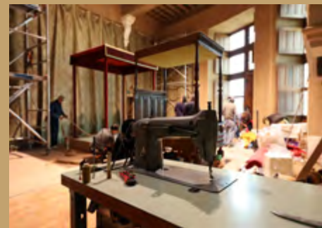
La chambre du roi en travaux