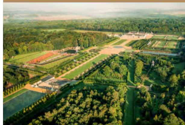
Château de Champ de Bataille

2018 Ouverture de l'Oscar, son premier hôtel à Londres